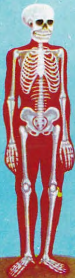
SKELTON OF BONES & FLESH