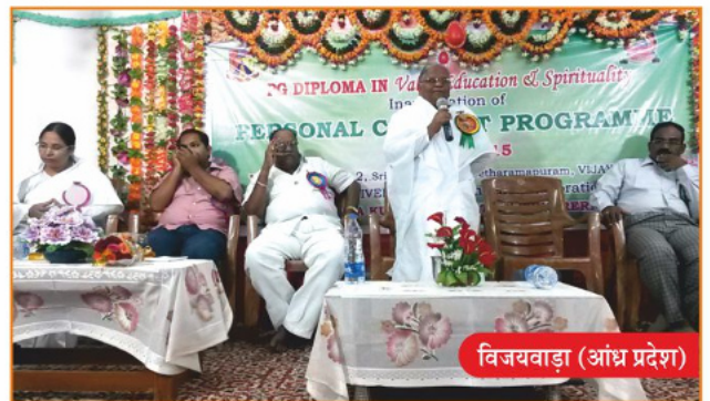
विजयवाड़ा (आंध्र प्रदेश)