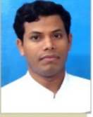
ब्र.कु. चुनेशा, शान्तिवन