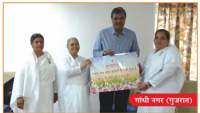
गांधी नगर (गुजरात)