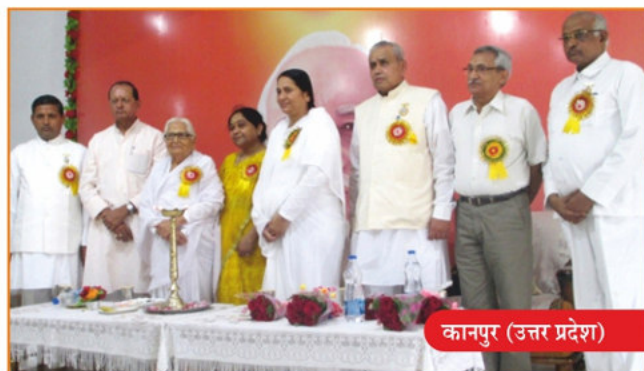
कानपुर (उत्तर प्रदेश)