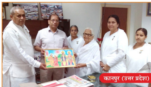
कानपुर (उत्तर प्रदेश)