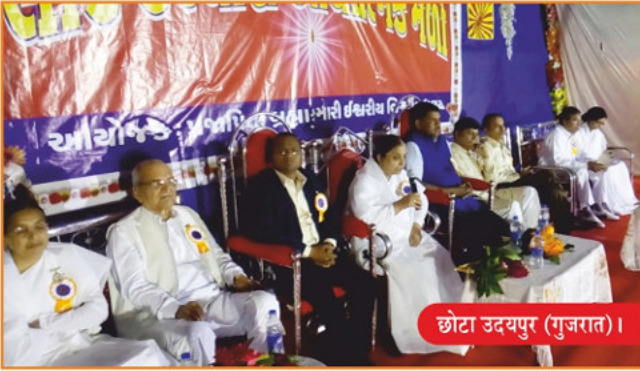
छोटा उदयपुर (गुजरात)।