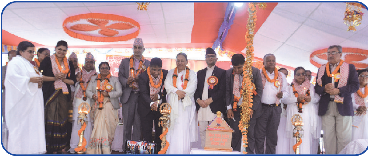
पोखरा-नेपाल। दिव्य दर्शन सरोवर शांति उद्यान के भवन शिलान्यास कार्यक्रम का दीप प्रज्वलित कर शुभारम्भ करते हुए राष्ट्रीय सभा के अध्यक्ष माननीय गणेश तिमिल्सिना और गण्डकी प्रदेश के माननीय उद्योग, पर्यटन, वन तथा वातावरण मंत्री विकास लम्साल तथा अन्य।

व्यवहार अगर अच्छा है तो मन ही मंदिर है। आहार अगर अच्छा है तो तन ही मंदिर है। विचार अगर अच्छे हैं तो मस्तिष्क ही मंदिर है। यह तीनों अगर अच्छे हैं तो जीवन ही मंदिर है।