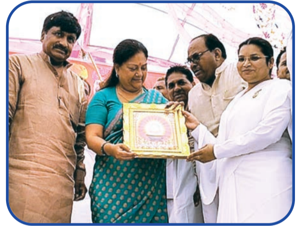
चौमहला-राज। पूर्व मुख्यमंत्री वसुंधरा राजे को ईश्वरीय सेवाओं से अवगत कराने के पश्चात् ईश्वरीय सौगात भेंट करते हुए ब्रह्माकुमारी बहन।