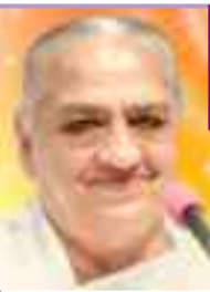
दादी हृदयमोहिनी अति. मुख्य प्रशासिका