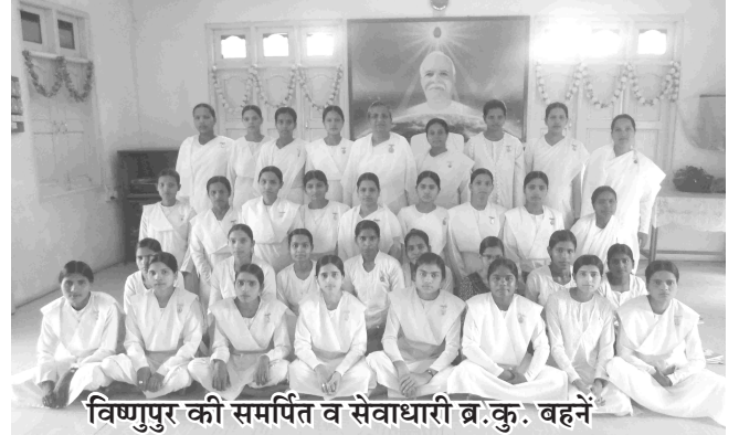
विष्णुपुर की समर्पित व सेवाधारी ब्र.कु. बहनें

इन्हीं 150 गाँवों के समूह के बीच 35 गाँवों में ब्रह्माकुमारीज पाठशालाएँ चलती हैं। फ्यू कस्बे के नजदीक विष्णुपुर (नौकाया) गाँव में राजयोग भवन मुख्य सेवाकेन्द्र है जहाँ 20 समर्पित कन्याएँ रहती हैं। सेवाकेन्द्र तथा