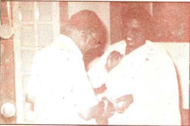
नई दिल्ली : ब० क० आशा बी० सी० रे, न्यायाधीश सर्वोच्च न्यायालय को राखी बांध रही हैं।