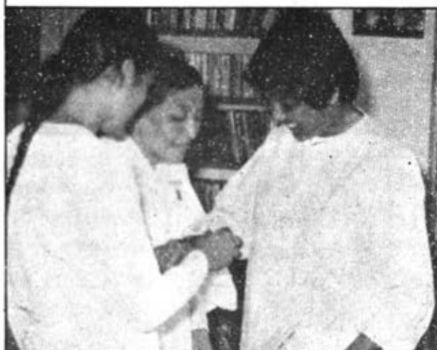
नई दिल्ली : ब० कु० बहिनें, बहिन किरण बेदी, आई० पी० एस० को स्नेह की सूचक राखी बांधती हुई ।