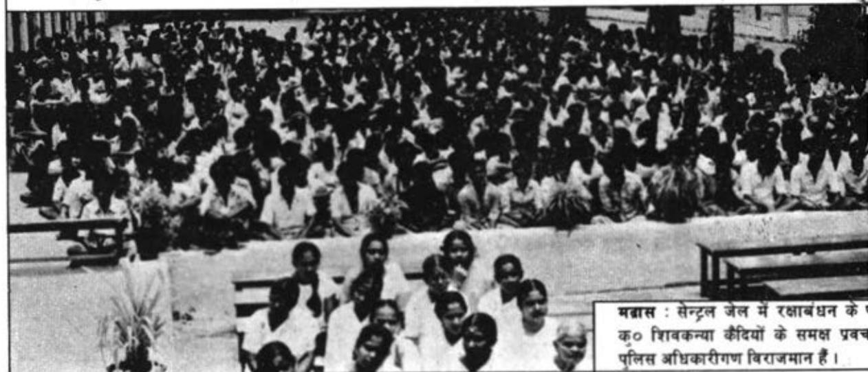
मद्रास : सेंट्रल जेल में रक्षाबंधन के प० क० शिवकन्या कैदियों के समक्ष प्रवचन पुलिस अधिकारीगण विराजमान हैं।