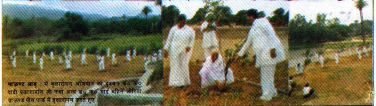
माऊण्ट आब् : में वृक्षारोपण अभियान का दृश्य। ब० क० दादी प्रकाशमणि जी तथा अन्य ब० क० भाई बहिन औरिया राऊण्ड पीस पार्क में वृक्षारोपण करते हुए।