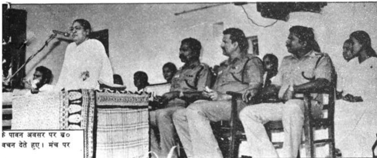
विपावन अवसर पर ब० वचन देते हुए। मंच पर