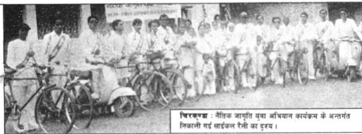
चिरकूण्डा : नैतिक जागृति युवा अभियान कार्यक्रम के अन्तर्गत निकाली गई साईकल रैली का दृश्य।