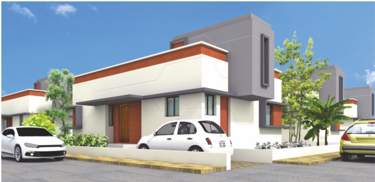
500 VAR (YARD) PLOT