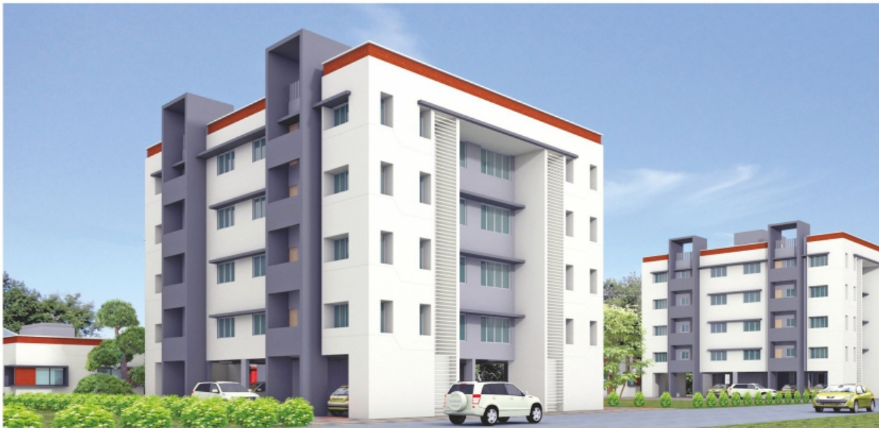
125 VAR (YARD) 2 - BHK FLAT