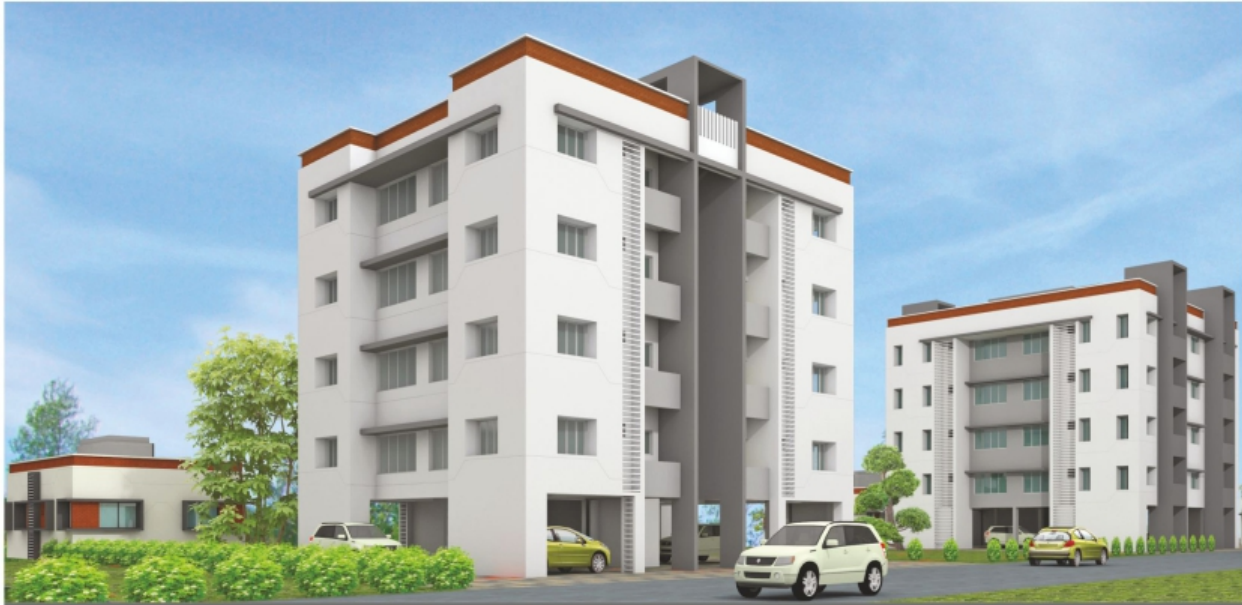
90 VAR (YARD) 1 - BHK FLAT