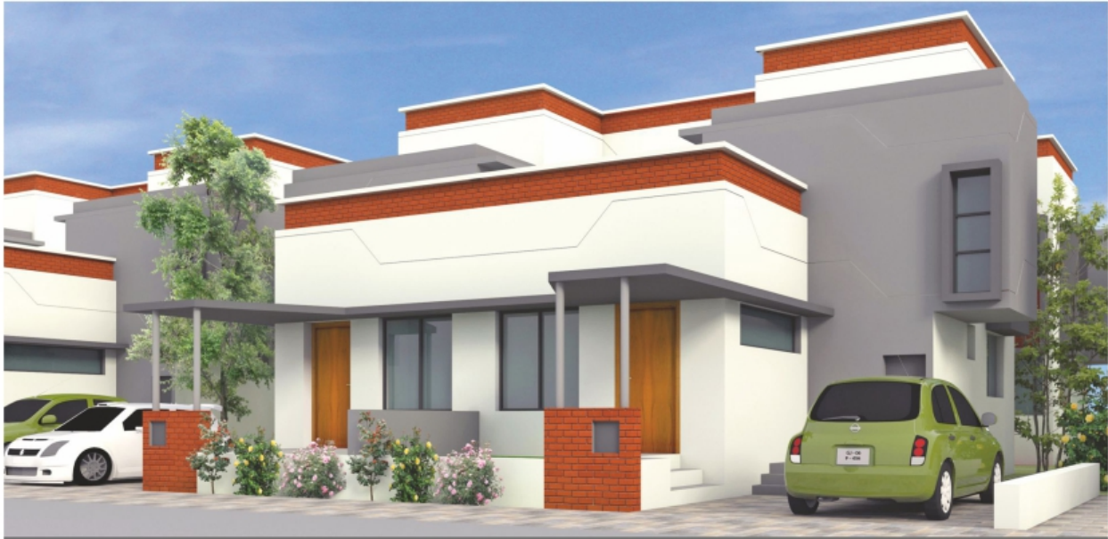
250 VAR (YARD) PLOT